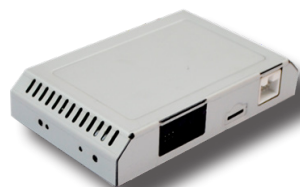
Centralina di controllo