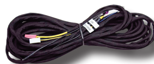
Cablaggio plug & play dedicato